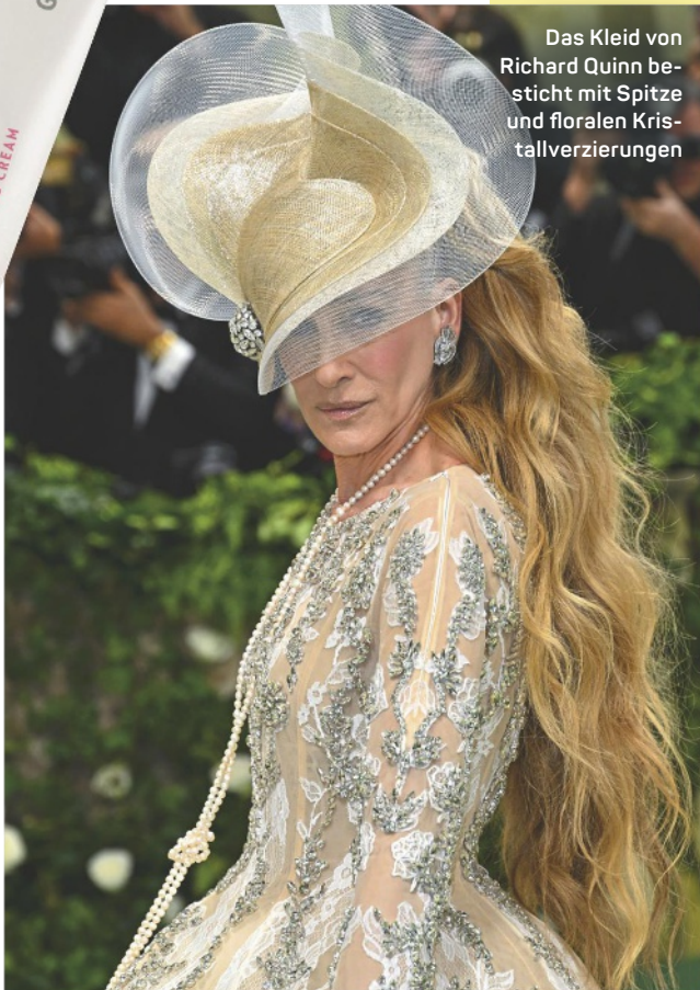
Das Kleid von Richard Quinn besteht mit Spitze und floralen Kristallverzierungen