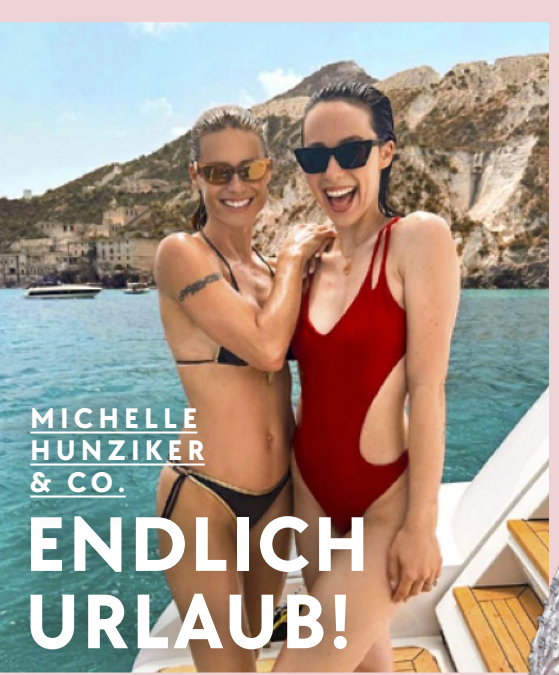
MICHELLE HUNZIKER & CO.