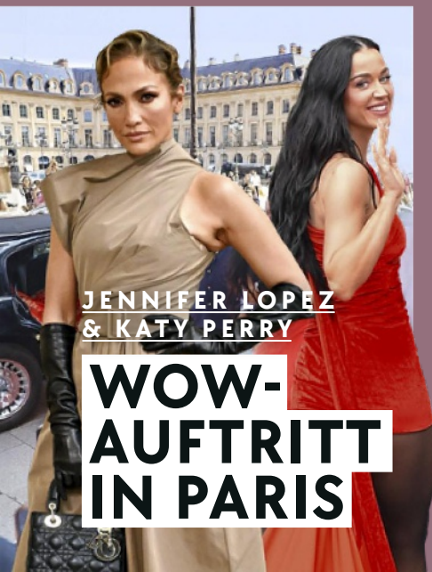
JENNIFER LOPEZ & KATY PERRY

CYNDI LAUPER Krisen haben sie stark gemacht