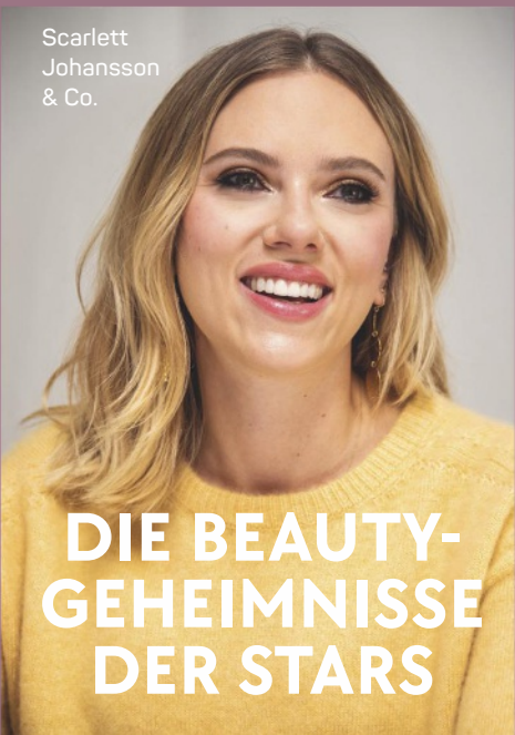
Scarlett Johansson & Co.