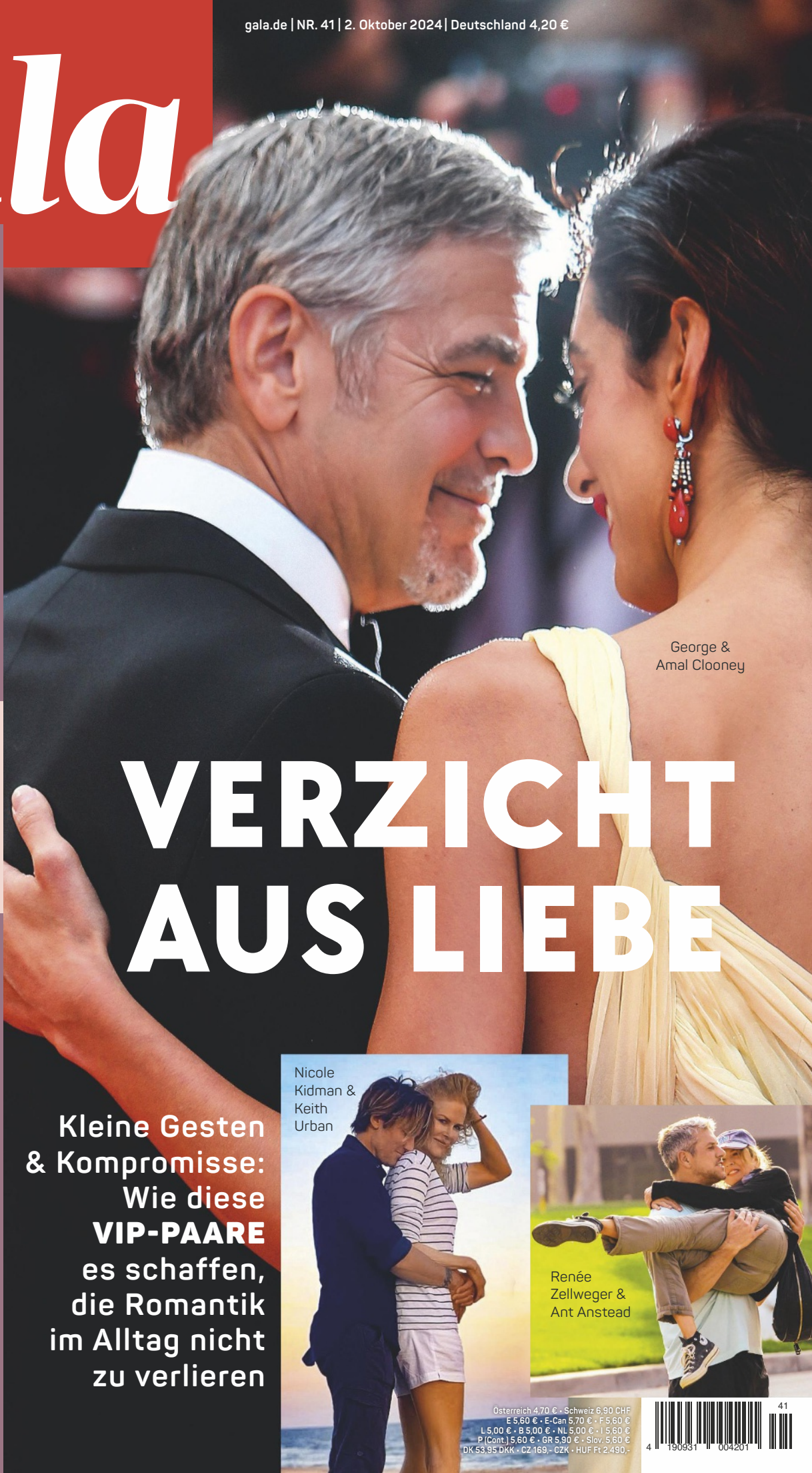
George & Amal Clooney