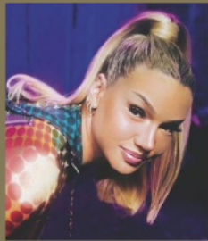
SHIRIN DAVID Bauch, Beine, Mega-Erfolg